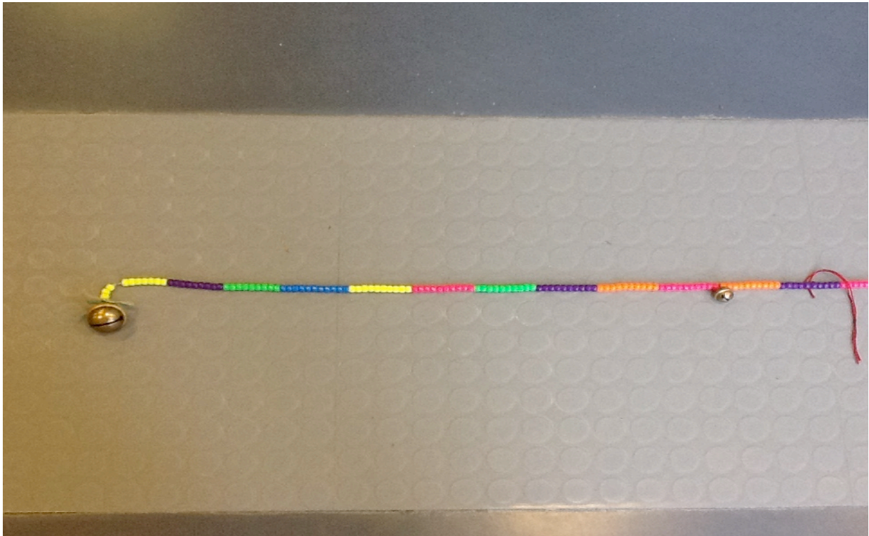
Bild 2: Ausschnitt der Zeitleiste mit großem und kleinen Glöckchen Nach einem Zeitraum von insgesamt je eintausend Jahren wurde ein Glöckchen aufgefädelt. Dann schließen sich die nächsten tausend Jahre an.